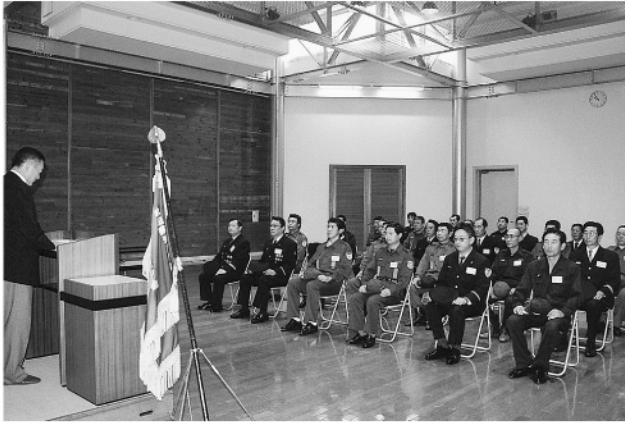
入 校 式